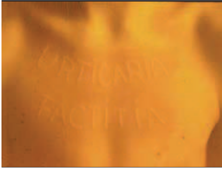
Obrázok 3. Plastický dermatografizmus – urticaria factitia.

plementom spúšťajú cirkulujúce imunokomplexy. Príčinou môžu byť cudzorodé séra, kryoglobulinémia, lieky. Pri alergickej reakcii tohto typu tvorí organizmus protilátky proti antigénom na povrchu telu vlastných buniek alebo tkanív. Pre reakciu III. typu je charakteristická tvorba imunokomplexov (17, 20, 30). Ukladanie takýchto imunokomplexov v organizme spôsobuje chronické ochorenia na autoimunitnom podklade, niekedy spojené so zvýšenou priepustnosťou kapilár – urtikariálnu vaskulitídu (12, 24, 26).